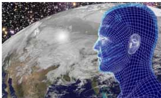
Contact avec la mémoire universelle