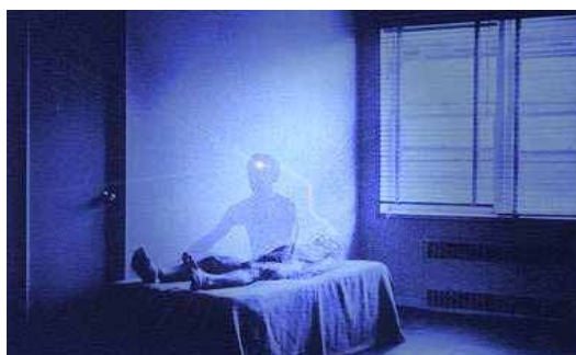
Sortie hors du corps