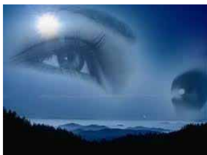
Vision à distance

Toutes ces études ont prouvé qu'il y a en l'homme une force qui n'est pas soumise aux lois de la physique. Elles ont prouvé aussi que les facultés psychiques ne sont pas des "dons" détenus par des privilégiés, mais existent à l'état latent en nous. Vous vous en rendrez compte lorsque vous prendrez connaissance des techniques qui président à leur manifestation.